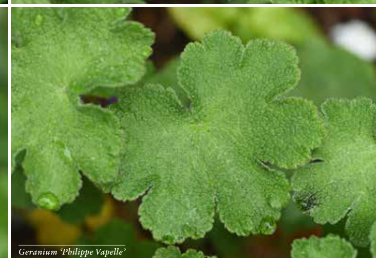
Geranium 'Philippe Vapelle'