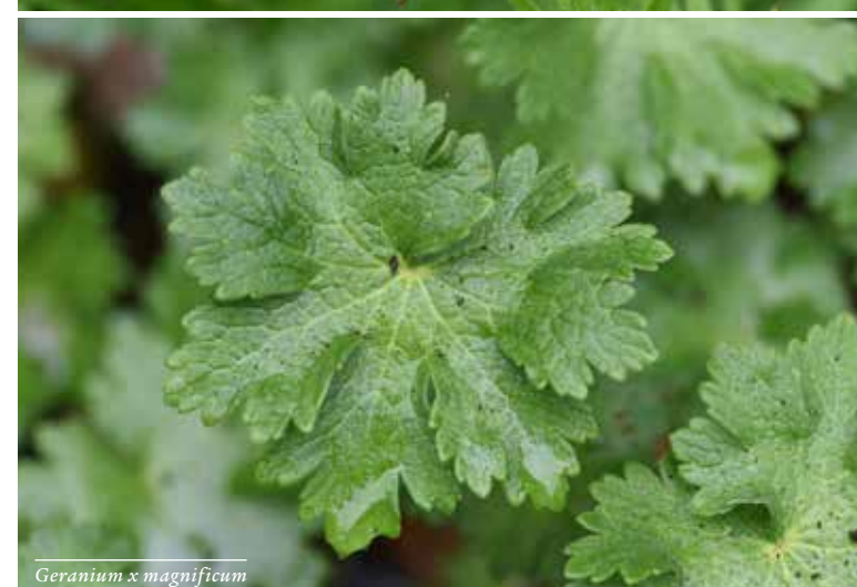
Geranium x magnificentum