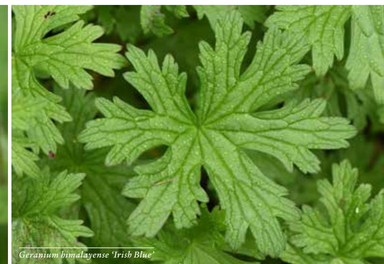
Geranium himalayense 'Irish Blue'