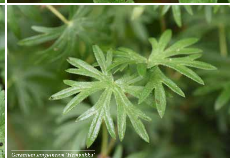
Geranium sanguineum 'Hempukka'

altijd stromend waar hij vroeger stroomde. In de lente ligt het accent op de vele bloeiende vaste planten en bollen, in de zomer draait alles om de vele groentinten en bladvormen.'