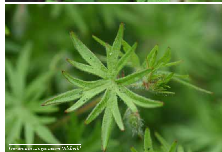
Geranium sanguineum 'Elsbeth'