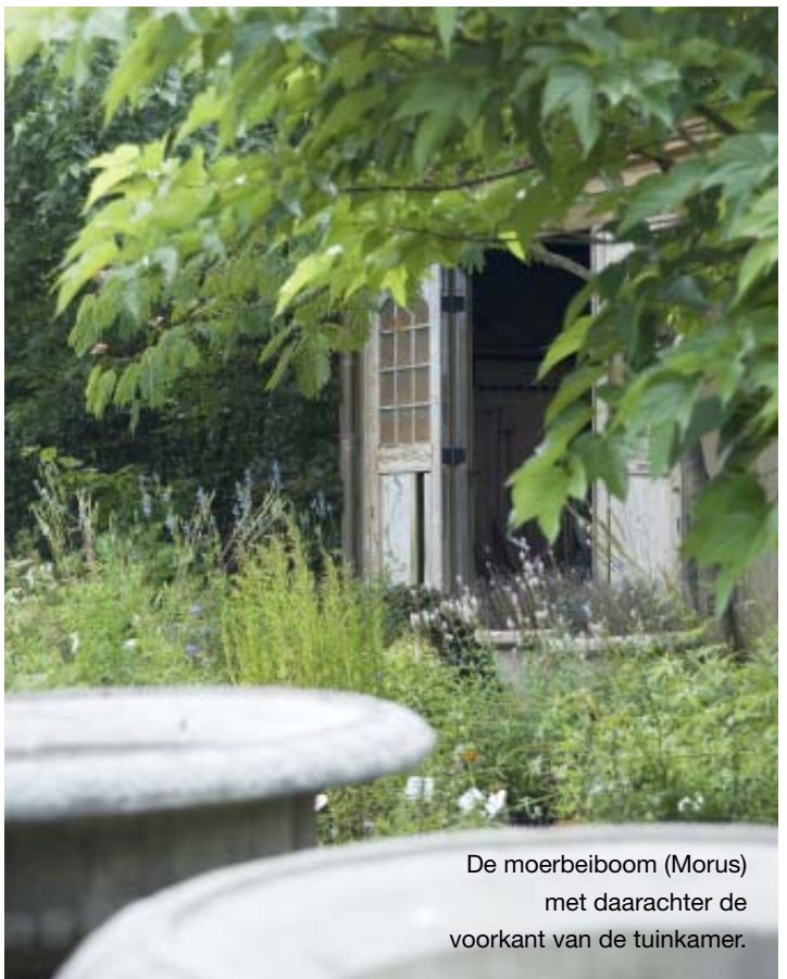
De moerbeiboom (Morus) met daarachter de voorkant van de tuinkamer.