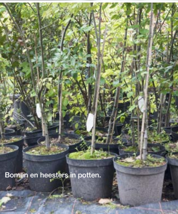
Bomen en heesters in potten.