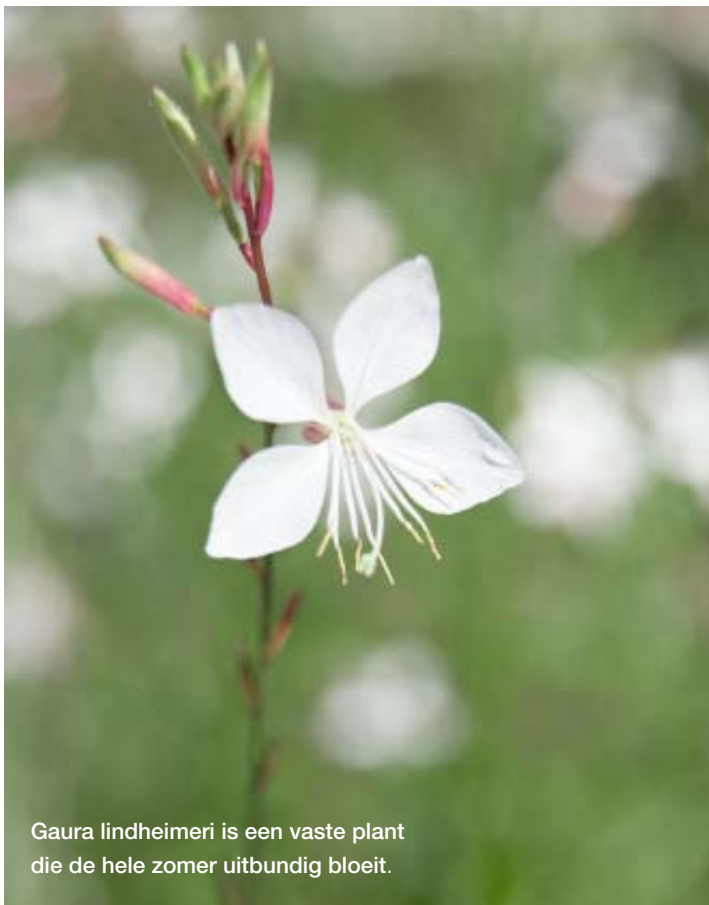
Gaura lindheimeri is een vaste plant die de hele zomer uitbundig bloeit.