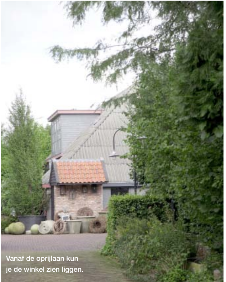
Vanaf de oprijlaan kun je de winkel zien liggen.