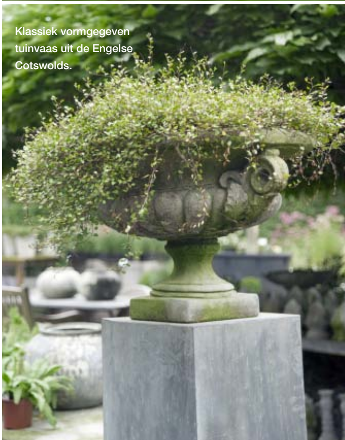
Klassiek vormgegeven tuinvaas uit de Engelse Cotswolds.