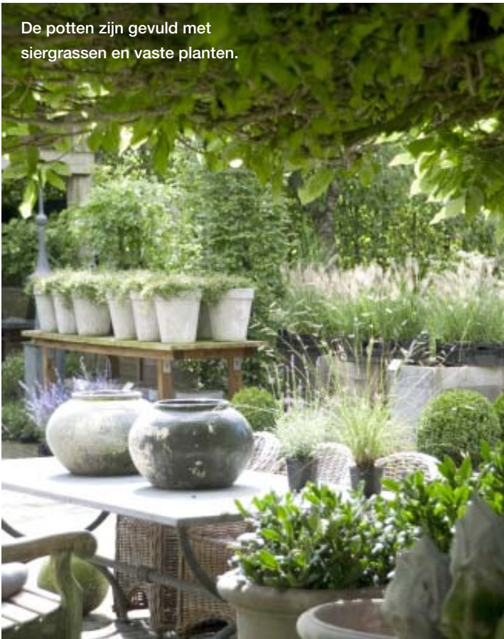
De potten zijn gevuld met siergrassen en vaste planten.