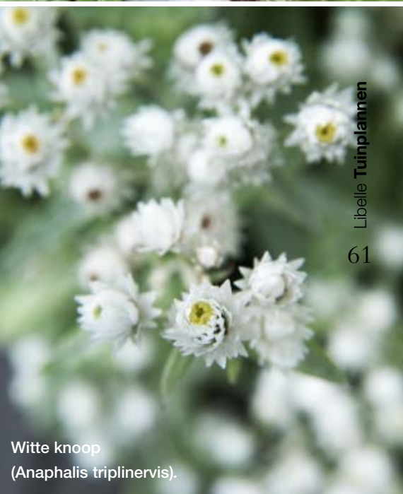
Witte knoop (Anaphalis triplinervis).