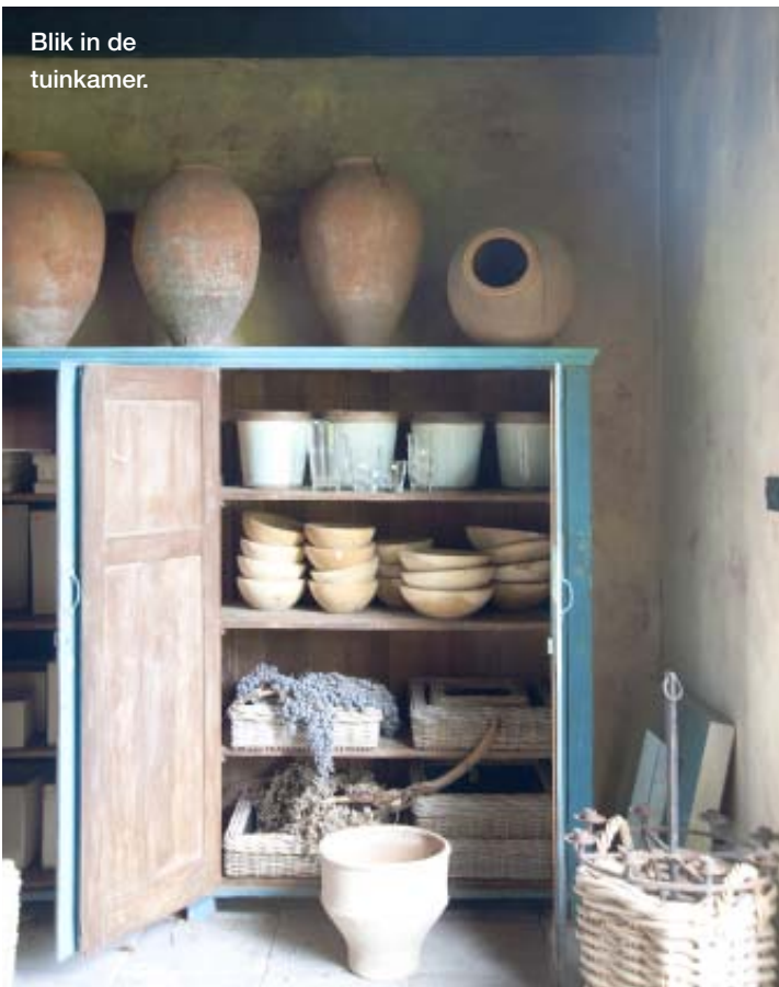
Blik in de tuinkamer.