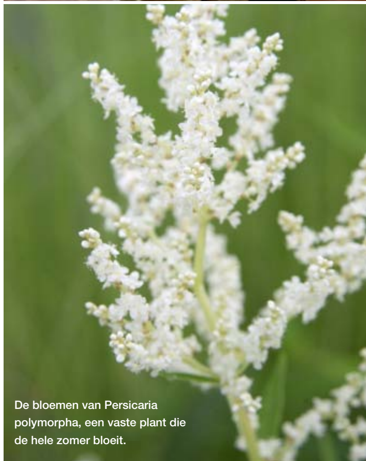
De bloemen van Persicaria polymorpha, een vaste plant die de hele zomer bloeit.