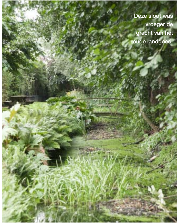
Deze sloot was vroeger de gracht van het oude landgoed.