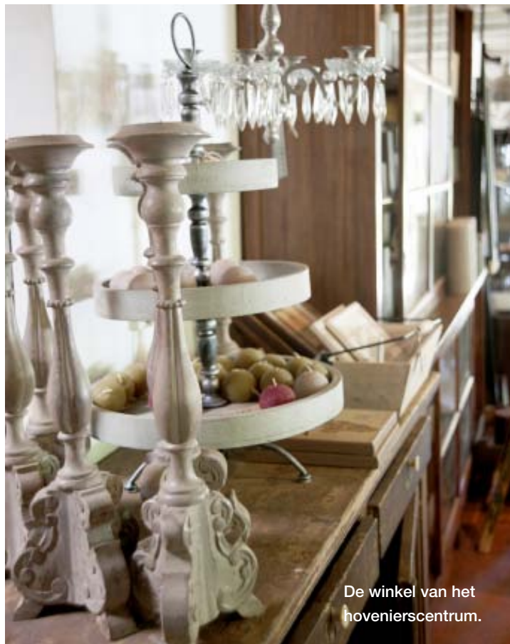
De winkel van het hovenierscentrum.