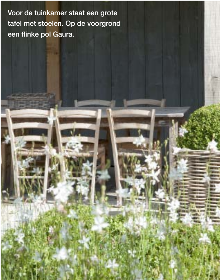
Voor de tuinkamer staat een grote tafel met stoelen. Op de voorgrond een flinke pol Gaura.